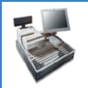
Gammes de T.P.V. IBM SurePOS 700