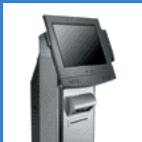
Borne IBM NetVista