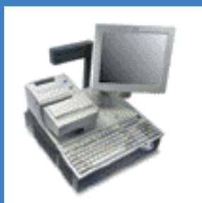
Terminal IBM SurePOS 4694